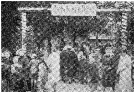
18. juni 1945. — Da skolen vendte tilbage til Munkegade efter «ufrivilligt» ophold i Frederikssalle.