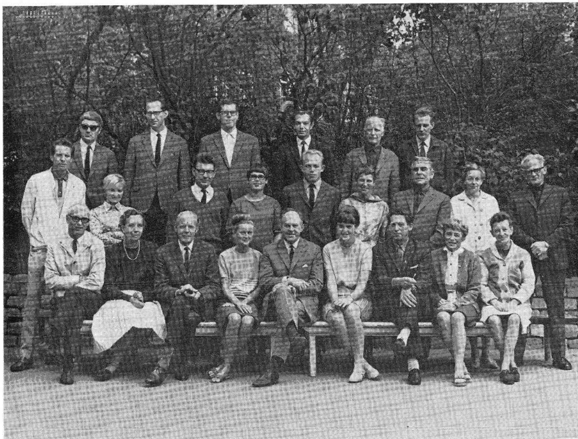
Lærerpersonalet på Ny Munkegades skole 1968.

Gamle elever husker også deres gamle skole som en